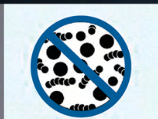
système de stérilisation par UV