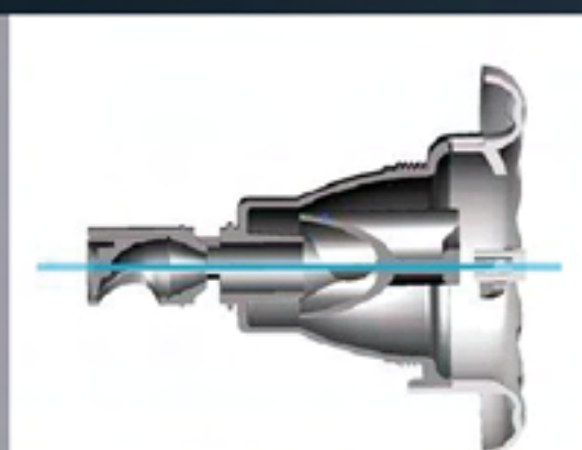
jet rotatif avec broche acier