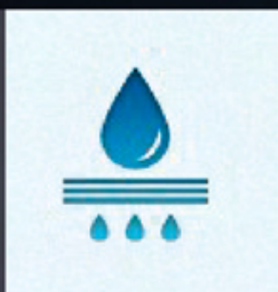
filtration purezone 1 micron