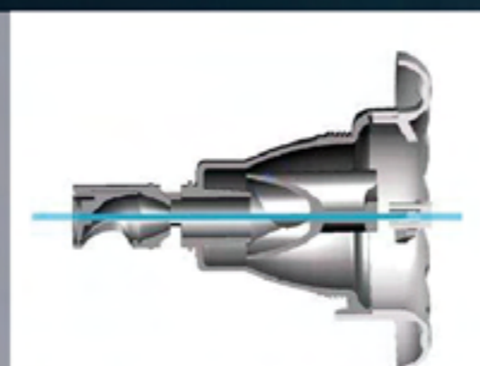
jet rotatif avec broche acier